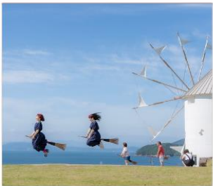
Shodoshima Olive Park เกาะมะกอก