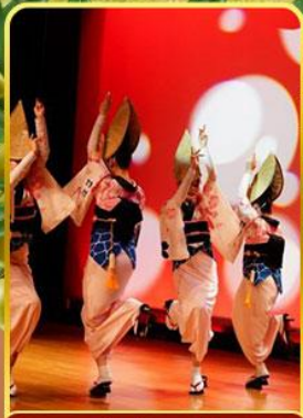
อะวะ โอะโตะริ โคคัง