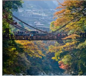
ชมสะพานคะซึระมาชิ