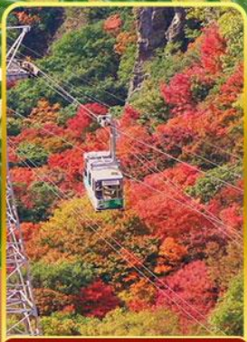
กระเช้าหุบเขาคังคาเคอิ