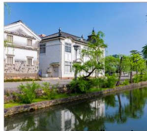
เขตอนุรักษ์เมืองเก่า คุราชิกิ