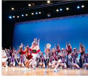
อะวะโอะโตะริไคดัง