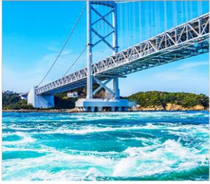
ช่องแคมนารุโตะ