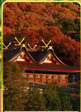
ศาลเจ้าคิมิฮิโกะ