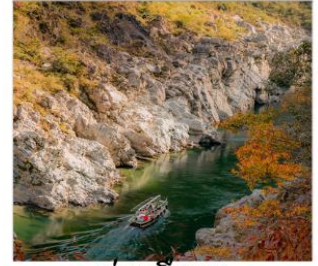
ล่องเรือชม หุบเขาโอบิโนเคะ