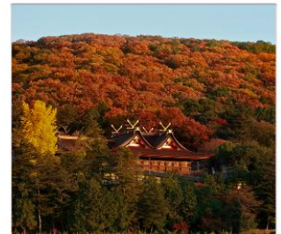
ศาลเจ้าคินิชิอิโกะ